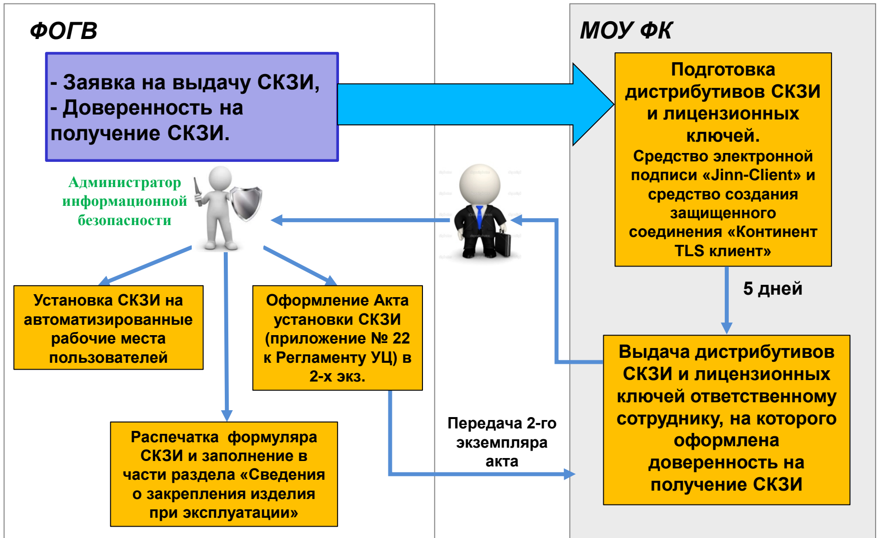
СХЕМА ПОЛУЧЕНИЯ И УСТАНОВКИ СКЗИ